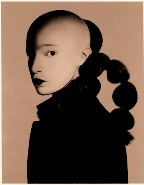
— Untitled, 2007 Tirage pigmentaire sur papier Fine Art coton