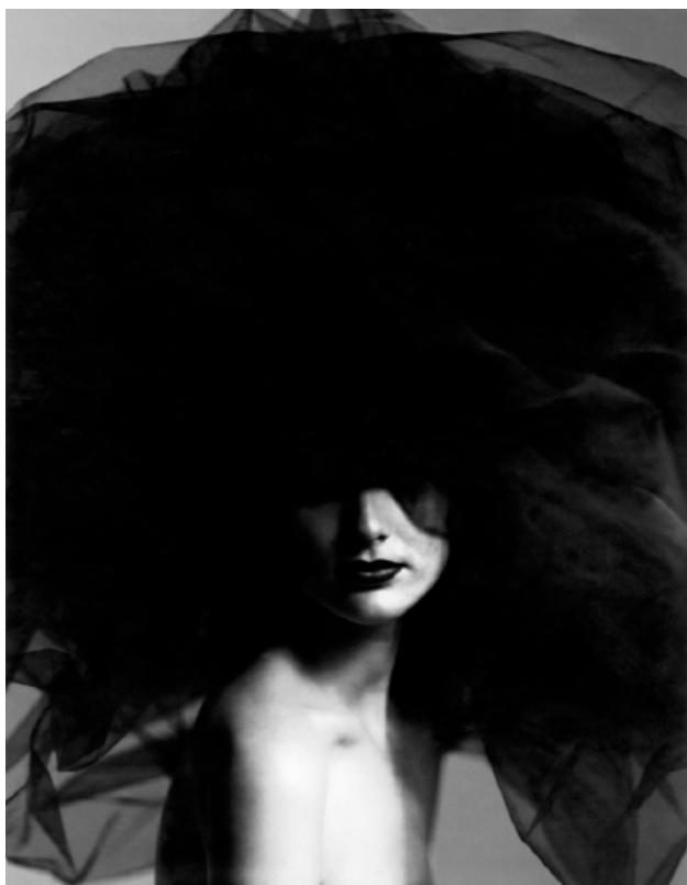
Shalom, 1990 Tirage pigmentaire sur papier Fine Art coton, 180 x 150 cm