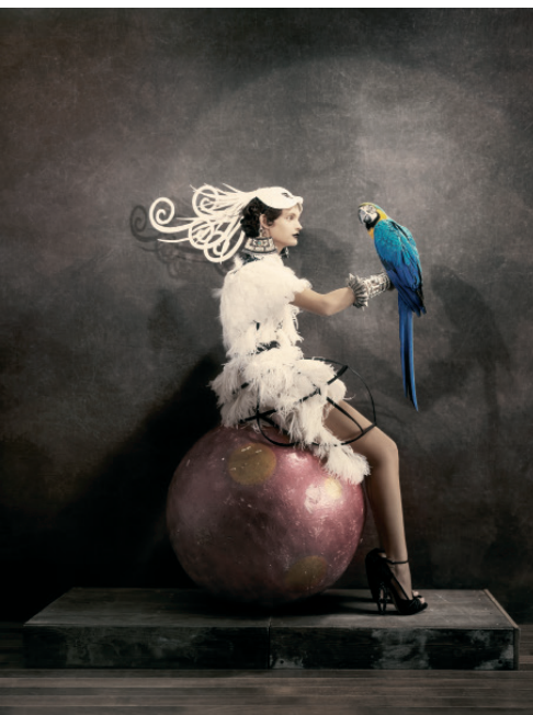
— Untitled (Parrot), 2008 Tirage pigmentaire sur papier Fine Art coton, 40 x 30 cm © Giovanni Gastel