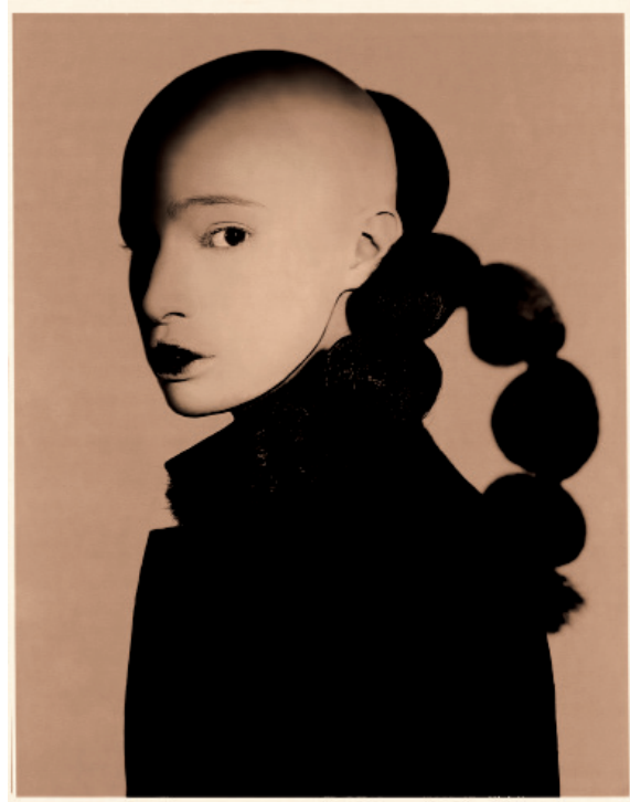
Untitled, 2007 © Giovanni Gastel