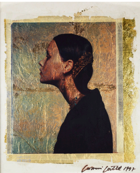
— Polaroid Oro 1, 1997 Polaroid sur fond d'or, 25 x 20 cm © Giovanni Gastel