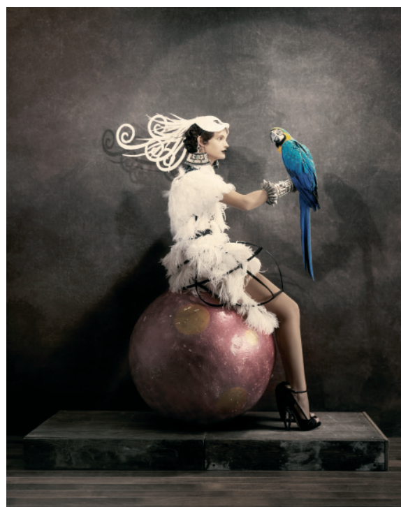
Untitled (Parrot), 2008 © Giovanni Gastel

L'exposition réunira une trentaine de tirages emblématiques autour d'un thème central : la femme.